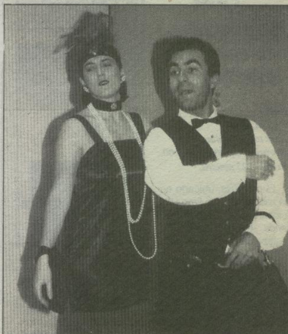
La representación tendrá lugar el próximo jueves.